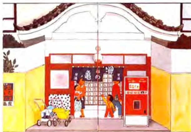
屋根が独特な形です