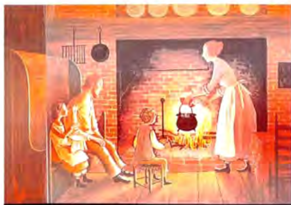
椅子から始まる生活ルーツ探し 「にぐるまひいて」