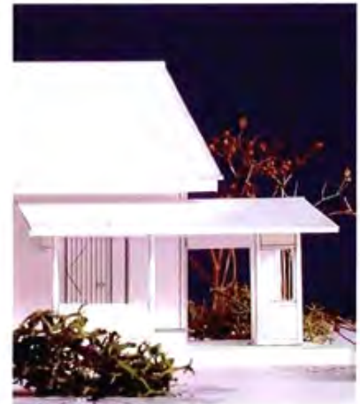
玄関前の「寄り付き」 右手に腰掛を設置