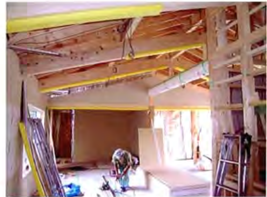
ダイニング・リビング

2年前に完成した建物の増築工事です。 今回は、個室の外でござせるゾーンをリビング、ダイニング、 サロン、廊下の4ヵ所に分け、好きな場所を選べるようにして います。 既存「ひまわり」の特徴となっている天井を飛ば丸太、今回は 太さ30cmの一本のみ。 その代わりに、「登り梁」と呼ばれる太い斜めの梁が天井に設置 されており、一味違うインテリアとなっています。