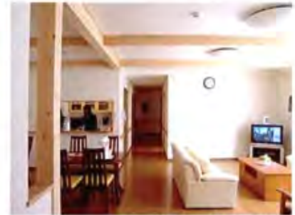
グループホームのLD

グループホームへは中庭を通過してアプローチ 左手のドアは、温室からの出口 奥の庭は菜園となっている