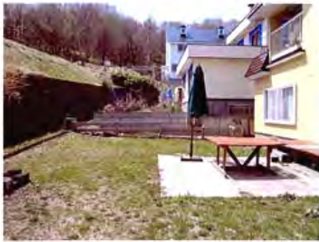
ご相談を受けた当時の庭