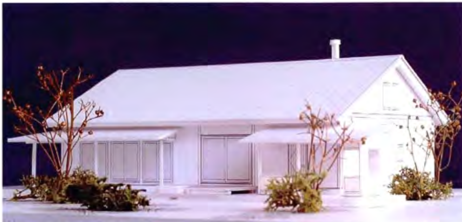
夏場、付け庇にはスタレを吊るす