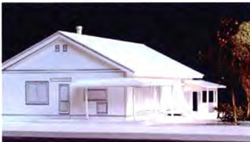
付け庇の下にニジリ口 左手ドアは水屋出入り口