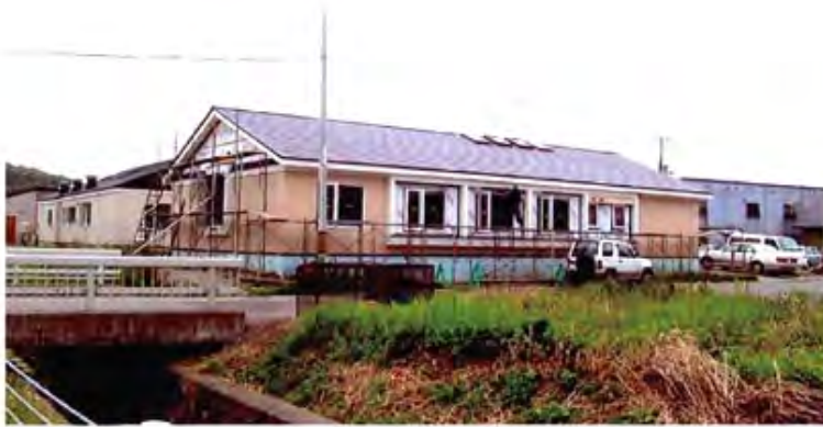
新ひだか町に建設中のグループホーム「ひまわり」

2年前に完成した建物の増築工事です。 今回は、個室の外でござせるゾーンをリビング、ダイニング、 サロン、廊下の4ヵ所に分け、好きな場所を選べるようにして います。 既存「ひまわり」の特徴となっている天井を飛ば丸太、今回は 太さ30cmの一本のみ。 その代わりに、「登り梁」と呼ばれる太い斜めの梁が天井に設置 されており、一味違うインテリアとなっています。